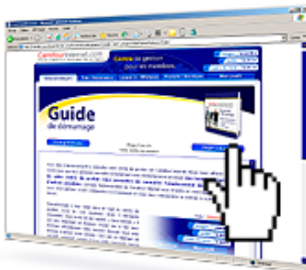
Extrait de la page du Guide de démarrage de Carrefour Internet

Nous vous encourageons à nous communiquer vos commentaires sur ce guide et à nous faire parvenir vos suggestions. Nous l'apprécierons grandement !