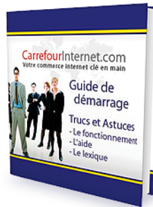
Guide de démarrage de Carrefour Internet.

De nombreux membres nous ont suggéré d'offrir une nouvelle dynamique pour le guide de démarrage. Ce dernier est votre premier contact avec les concepts et le fonctionnement de Carrefour Internet. Il est votre premier outil d'apprentissage et celui qui vous accompagnera au cours de votre carrière avec nous.